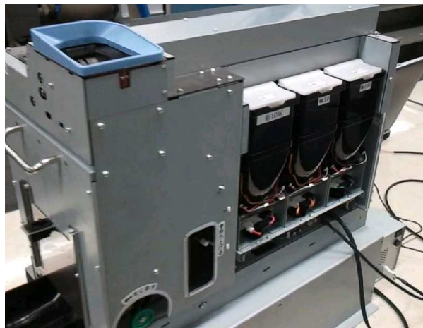
☞ 순환 호퍼 (우측 3개)