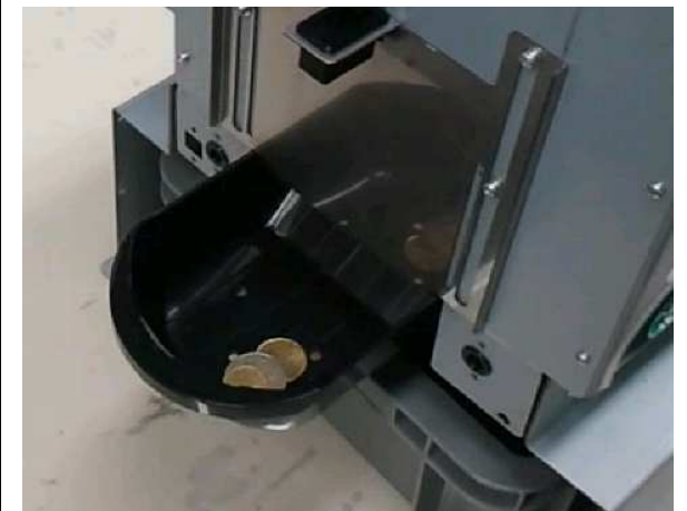
☞ 반환모습 (거스름돈 / 불량주화)