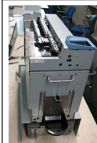
☞ CRU KRW 전면 모습