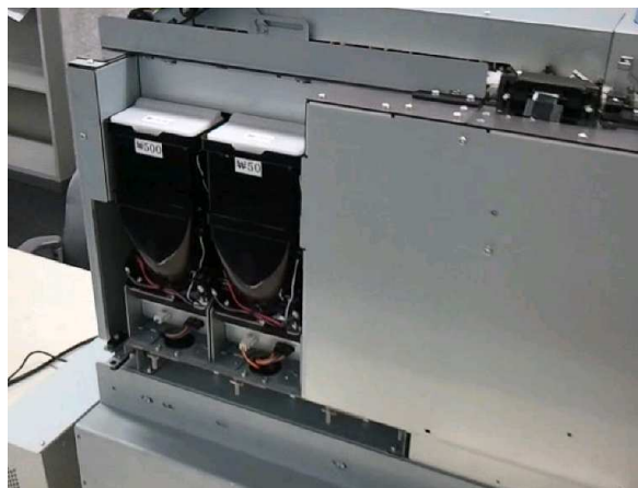
☞ 순환 호퍼 (좌측 2개)