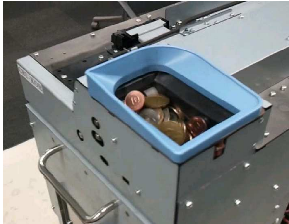
☞ 50매 일괄 투입 모습