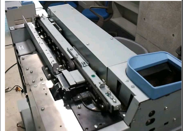
☞ 동전 이송 벨트 모습